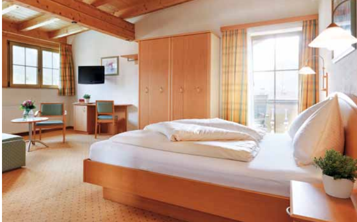
Doppel- oder Familienzimmer Sternenzimmer