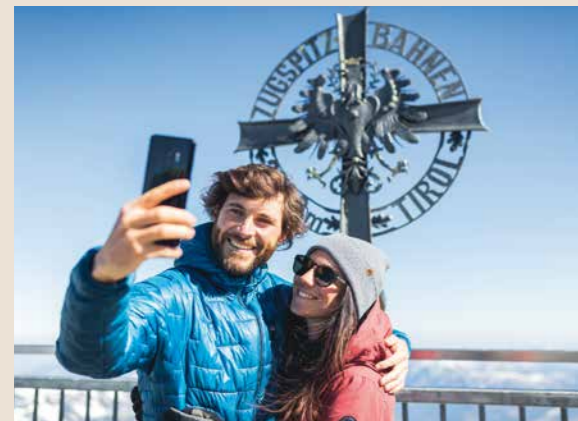
Konzept & Design Anita Posselt Werbeagentur.

Preise pro Person und Tag/Woche in Euro zzgl. Ortstaxe (€ 3,- pro Person und Tag ab dem Jahrgang 2005 im Jahr 2021 bzw. 2006 im Jahr 2022). Abweichungen von den Zimmerbildern sind möglich. HP = Halbpension.